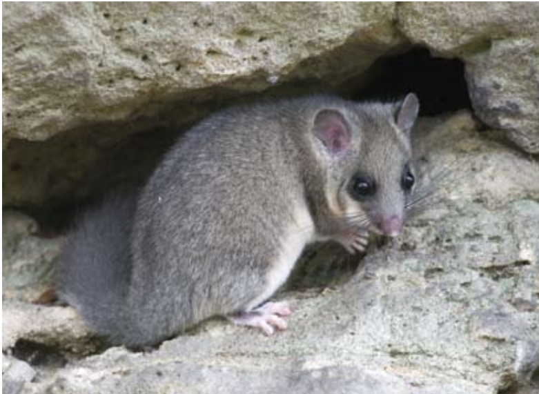
Siebenschläfer unterhalb der Arnsteinaussicht, 10.10.2009

Schweiz zu Hause ist. Selbst in entlegenen Felsengebieten konnten sie gesichtet werden.