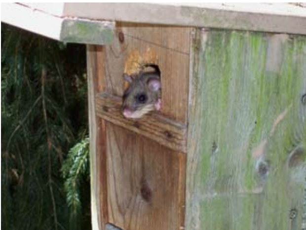
Siebenschläfer nahe der Kleinen Liebe