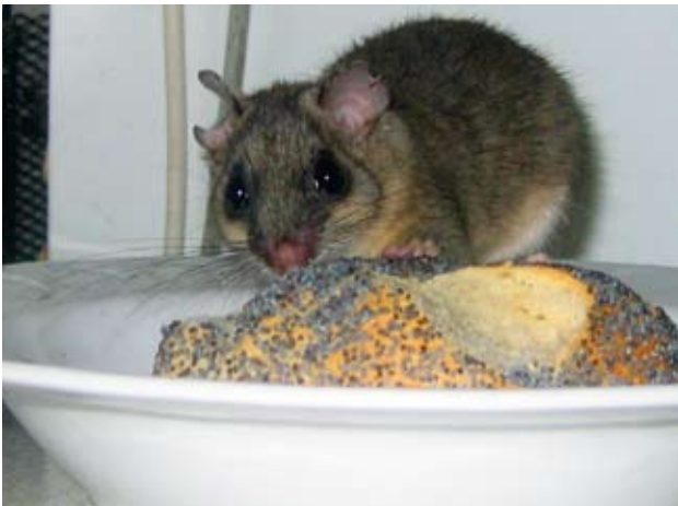
Auch Mohnbrötchen schmecken einem Siebenschläfer mit etwas ausgefranstem Ohr, Foto: Anja Kretzschmar