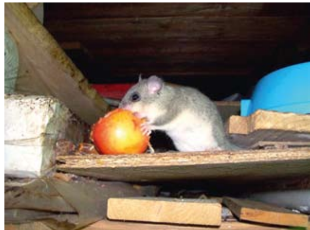
Die Untermieter in einer Schmilkaer Hütte werden mit Obst verwöhnt