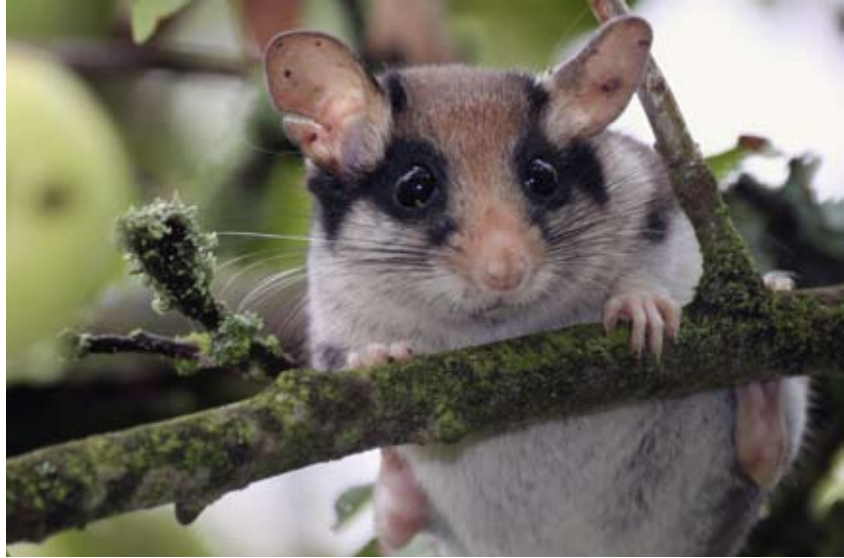
Gartenschläfer sind gute Kletterer.

Gartenschläfer und Siebenschläfer hören beide auf den Namen Bilch, sind aber verschiedene Arten aus der Gruppe der Schlafmäuse. In den Berghütten, Pensionen und wald-