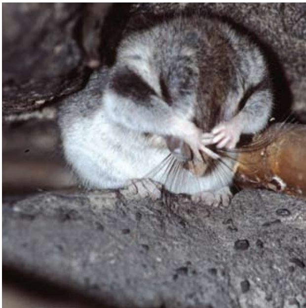
Ein Gartenschläfer in der Nymphenbadboofe im Jahr 2001 zeigte wenig Scheu und putzte sich ausgiebig nach der Mahlzeit – trotz Mensch und Kamera.

nahen Häusern der Sächsischen Schweiz ist der Siebenschläfer inzwischen ein regelmäßiger, oft ungebetener Gast.